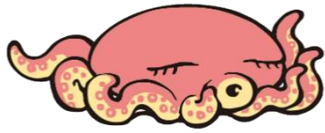
タコ・デラックス (たこ)