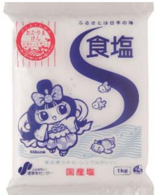
パッケージに「そるるんひめ」を掲載している「食塩 1kg」