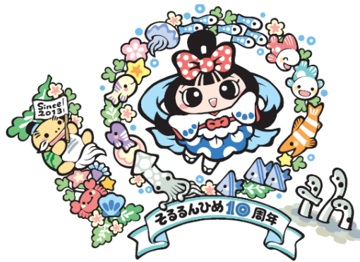
そるるんひめ 10 周年記念ロゴ

今回「そるるんひめ」が 10 周年を迎えるにあたり、10 周年記念ロゴを設定するとともに、「そるるんひめ 10 周年記念 大喜利大会」を行うことといたしました。多数の方に応募いただくことで、長年日本の台所を支えてきた「食塩シリーズ」に改めて思いを寄せていただくとともに、皆さまが、暮らしに欠かせない「塩」というものを振り返るきっかけになることを期待しています。