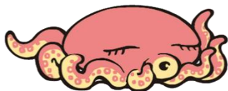
タコ・デラックス (たこ)