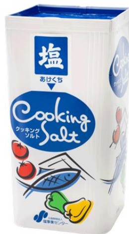
リニューアル後のパッケージ

公益財団法人塩事業センター（東京都品川区、理事長：斎藤恭一）は、くちばし型の振出口付きの箱型タイプ商品「クッキングソルト 800 g」について、開け方・使い方を図示する等のパッケージリニューアルを実施しました。「クッキングソルト 800 g」は、メキシコ産天日塩を国内で溶かしてつくった、さらさらタイプのロングセラー商品です。令和 7 年 12 月現在、新パッケージ品は既に一部の店頭に登場しています。