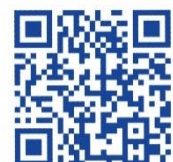
動画の QR コード